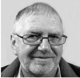
Merwin Bader Metallkunst